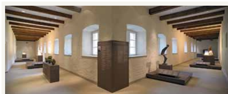
3 Das Déambuloire Raum und Werke des Bildhauers Lucien Wercollier harmonisieren in Perfektion The ambulatory serenity and harmony for Wercollier's works of art