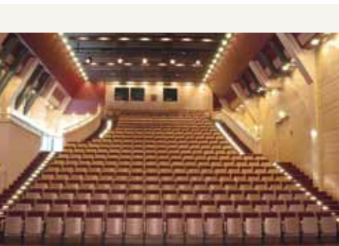
2 Der Saal Robert Krieps ein authentischer Theatersaal, geeignet für unterschiedliche Veranstaltungen, Konferenzen und Kolloquien The hall Robert Krieps suitable for all kinds of events, conferences and colloquies