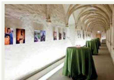
7 Der Kreuzgang Räumlichkeit für Ausstellungen und außergewöhnliche Empfänge The cloister exhibition space and exceptional spot for receptions

On a surface of 12.000 m 2 the CCRN offers rooms for 20 up to 180 people, an auditorium with suitable seating for 300 people, an agora covered by a glass roof, a magnificent square for big cultural and commercial events as well as a cloister and its adjacent garden and exhibition spaces. On the second floor, under heavy woodwork, a customizable room connected to high standard kitchens is used for banquets, lunches, dinners or other events.